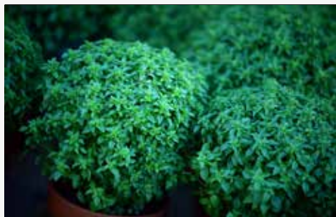
Quinta Pedagógica (Caminho dos Quatro Caminhos – Junto à Igreja de Real)