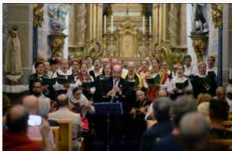
Biblioteca Lúcio Craveiro da Silva