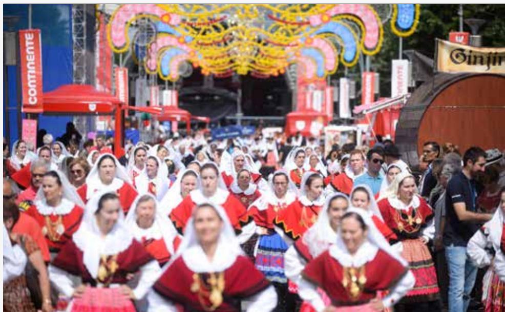
Largo da Devesa (Início)