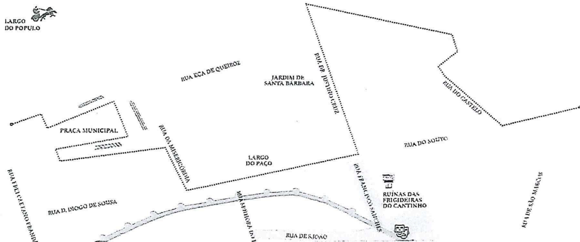
Fig. 1 – Percurso Cortejo