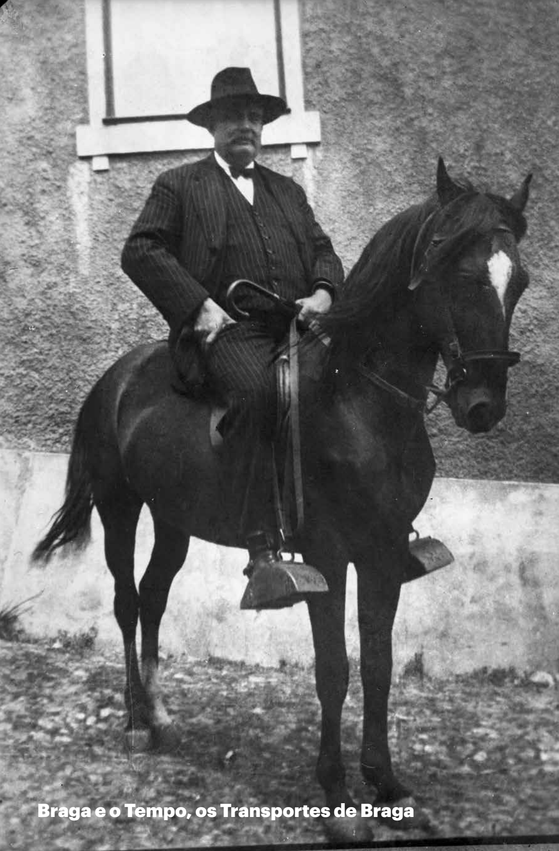
Braga e o Tempo, os Transportes de Braga