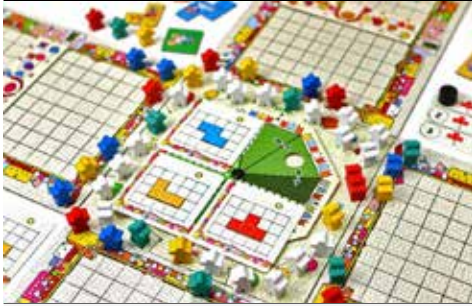
Ludoteca da Estufa – Parque S. João da Ponte