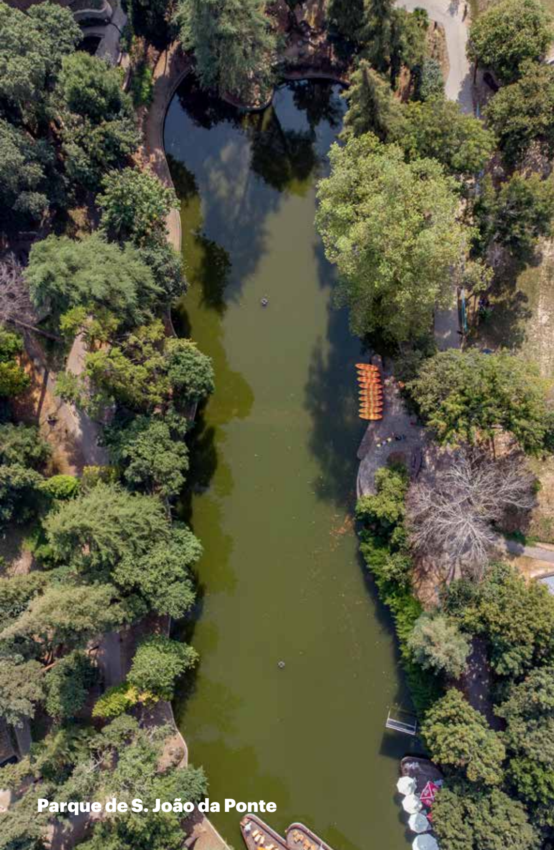
Parque de S. João da Ponte