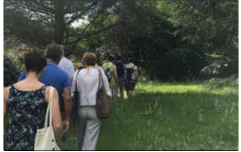
Mosteiro de Tibães