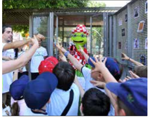
Biblioteca de Jardim – Av.Central