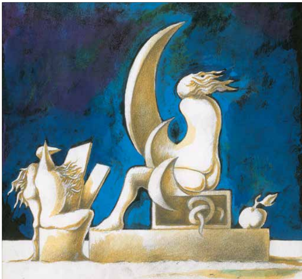
Casa dos Crivos