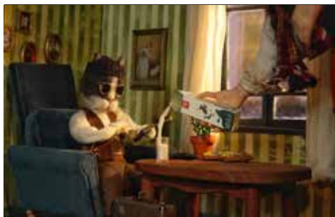
Casa dos Crivos