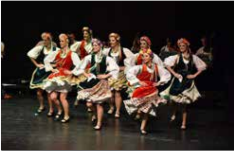
Praça Municipal (Palco)

PERCURSO: PRAÇA MUNICIPAL, R. DA MISERICÓRDIA, R. DO SOUTO, AVENIDA CENTRAL, R. DOS CAPELISTAS, R. EÇA DE QUEIRÓS, PRAÇA MUNICIPAL.