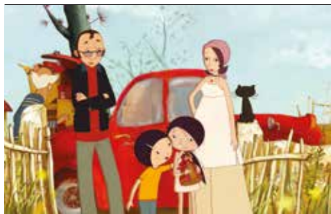
Casa dos Crivos