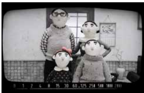
Casa dos Crivos