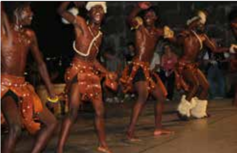
Praça Municipal (Palco)

Rusga de São Vicente de Braga – Grupo Etnográfico do Baixo Minho (Braga, Portugal); Atlan Bulag (Buriácia); Ballet folkloórico de la Universidad Autónoma de Coahuila (México); Danzart Bolivi (Bolívia); Kud Ljubomir Ivanovich Gedza (Servia); Identidad Peru (Peru); Nairobi Ensemble (Quénia); Folk Ensemble “Preporod” Dugo Selo (Croácia).