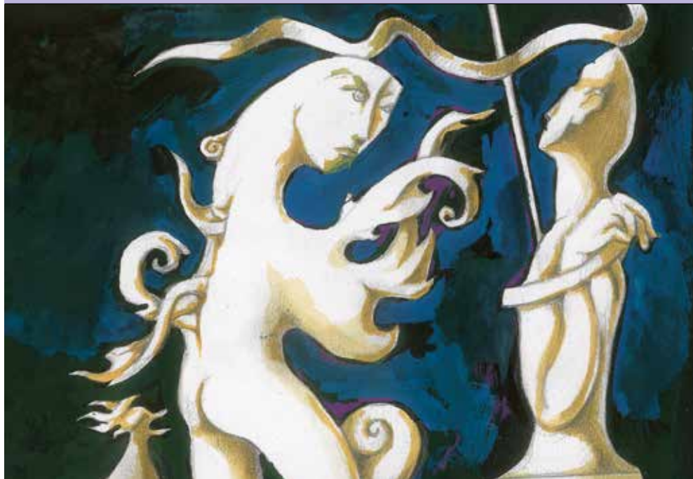
Casa dos Crivos