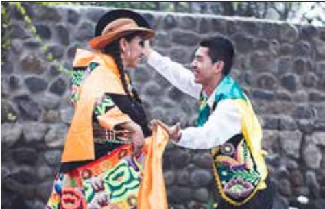
Praça Municipal (Palco)

Grupo Folclórico Dr. Gonçalo Sampaio (Braga, Portugal); Ballet folkloórico de la Universidad Autónoma de Coahuila (México); Danzart Bolivi (Bolívia); Atlan Bulag (Buriácia); Kud Ljubomir Ivanovich Gedza (Servia); Nairobi Ensemble (Quénia).