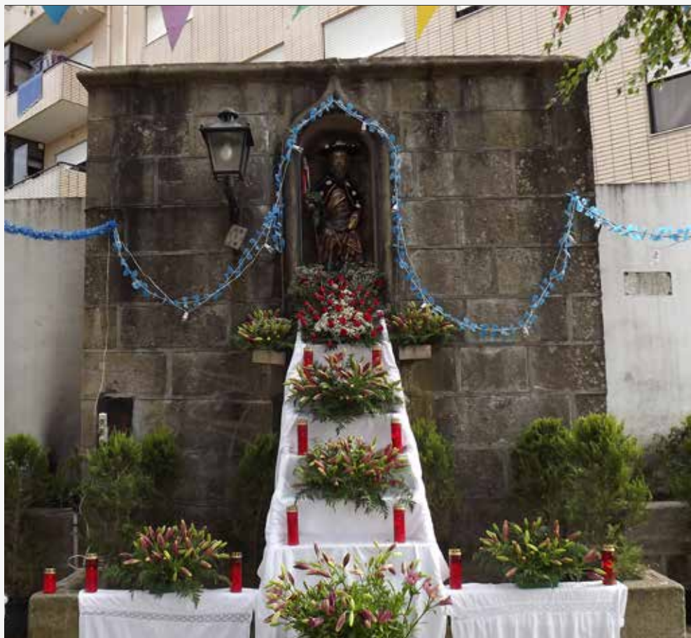
Largo de Santiago (Ponto de encontro)