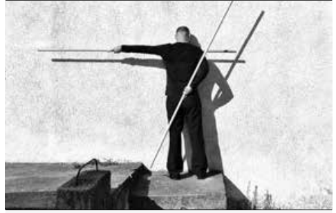
Museu Nogueira da Silva