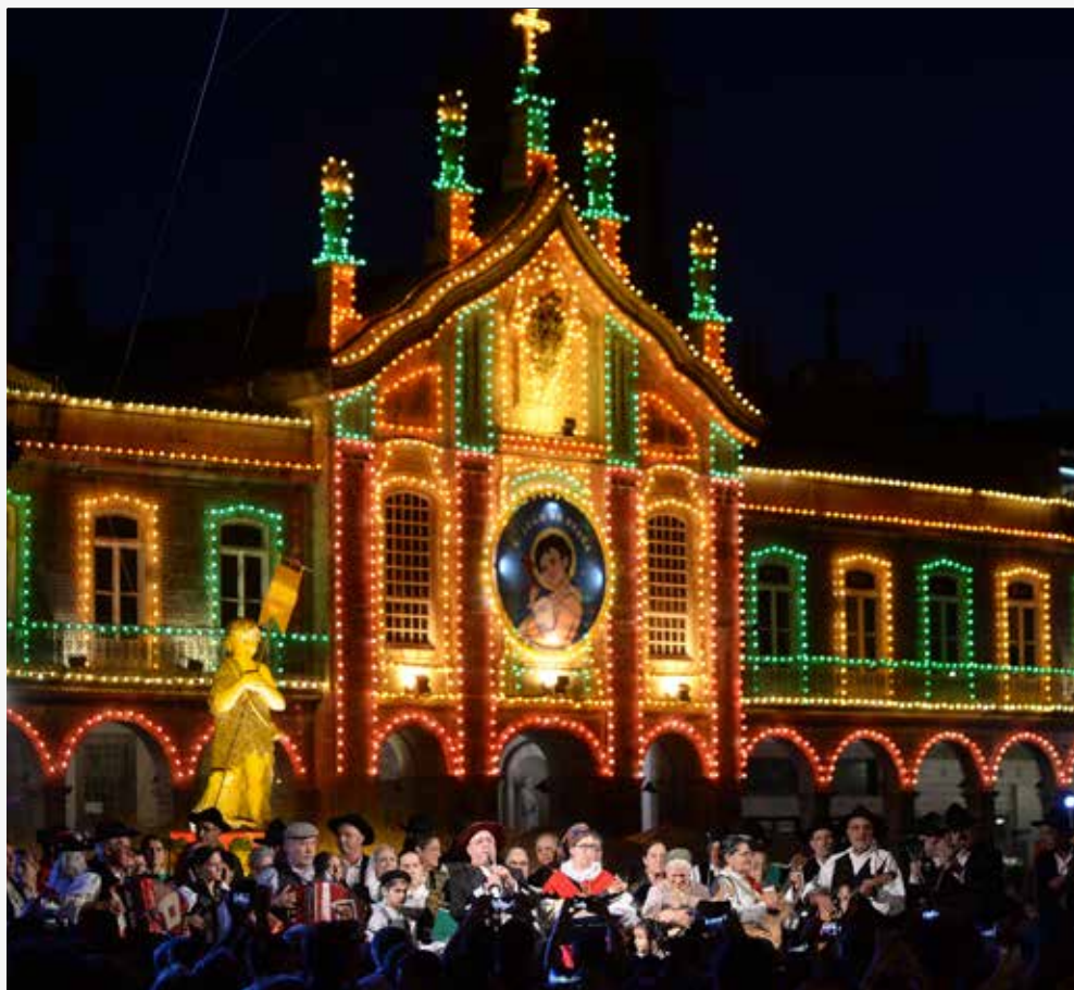
Praça do Artesão