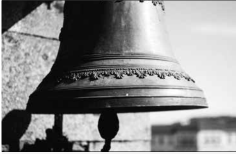
Hotel do Parque do Bom Jesus do Monte