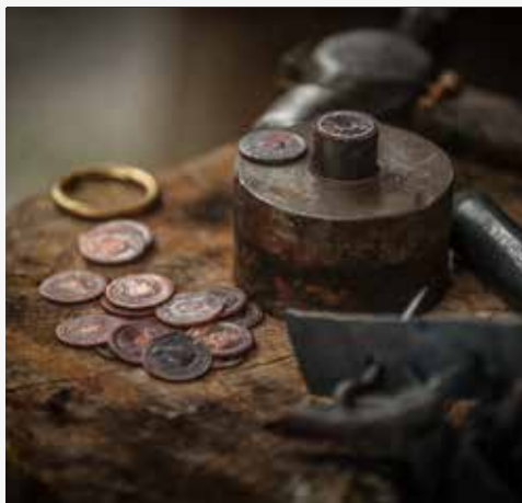
Largo S. João do Souto e Largo Paulo Orósio

A admiração, o respeito e tratamento nutrido por determinados animais era muito importante no seio da civilização romana, chegando mesmo a usa-los como figura principal das insígnias de poder civil e militar, como é caso da águia de Júpiter. Eram também muito apreciados no plano religioso e da adivinhação bem como na sua ostentação. Neste espaço recriado para si, inserido na área do acampamento legionário (Castra VI Victrix), poderá apreciar a arte de cuidar, treinar para a caça e a demonstração de voos bem como a beleza de Equídeos que farão pomposos circuitos pelo mercado.