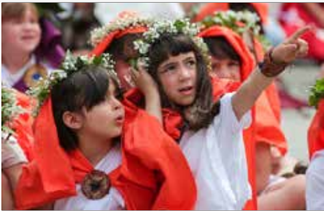
Av. Liberdade (Ponto de Encontro/Pueri–Crianças) Termas da Cidade (Pto. Encontro/Luvenes–Jovens)

Culminar da dinamização dos jogos do Moinho, Soldado, Seega e Tábula, em contexto escolar, no âmbito do Projeto Educativo Centurium. Alunos oriundos de diversas escolas de vários concelhos vão defrontar-se para apurar o vencedor absoluto em cada jogo e em cada escalão, nomeadamente: Primus Cycle; Secundus Cycle; Tetrium Cycle; Secundarium e Inclusat. Sem esquecer os professores decorrerá, em simultâneo, um Torneio para Professores (Institutor) e ainda um concurso para nomear “O Melhor Tabuleiro” (Optimus Certamine Tabula), dos elaborados pelas diferentes escolas participantes.