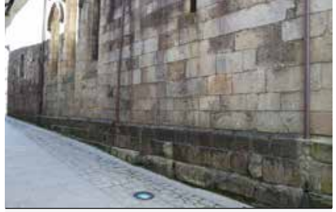
Rua Nossa Senhora do Leite

As escavações realizadas pela Unidade de Arqueologia da Universidade do Minho entre as décadas de 80 e 90 do século passado, terminadas em 2000, permitiram descobrir as ruínas de um quarteirão residencial da cidade romana, delimitado por ruas, ladeadas de pórticos. Objeto de sucessivas remodelações a casa Insulae (quarteirão) das Carvalheiras conheceram a sua última ocupação entre os séculos VIII/IX. O projeto construtivo mais antigo data das últimas décadas do século I e está representado por uma elegante domus (casa familiar), de átrio e peristilo, que se desenvolve em duas plataformas distintas. Umas décadas mais tarde, em meados do século II, a metade norte da casa foi alterada na sua funcionalidade, devido à construção de um balneário público, situado na parte noroeste. A área envolvente foi igualmente alterada, com o antigo peristilo a ser transformado em palestra e os espaços envolventes em lojas. A partir de então só a parte sul do quarteirão permanece ocupada como habitação, a qual, jamais vai recuperar o requinte da habitação original.