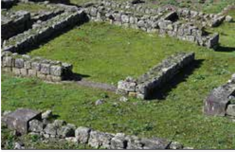
Largo das Carvalheiras