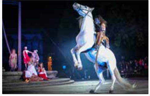
Palco Neptune – Pátio do Museu D. Diogo de Sousa

Aquando do nascimento de uma criança, esta era sujeita à aprovação do Pai (pater familias) que ao pegar nele (Tollere filium) indicava a sua aceitação! Após aceite, somente passados oito dias para as raparigas e nove para os rapazes, ocorria o Dies Lutricius, uma cerimónia de purificação, com a dádiva do seu nome e da respetiva família, para apresentação à sociedade. Das ofertas feitas à criança neste dia, destaca-se a Bulla, que acompanhará a criança até imposição da toga viril, no caso dos rapazes, e ao dia do casamento no caso das raparigas.