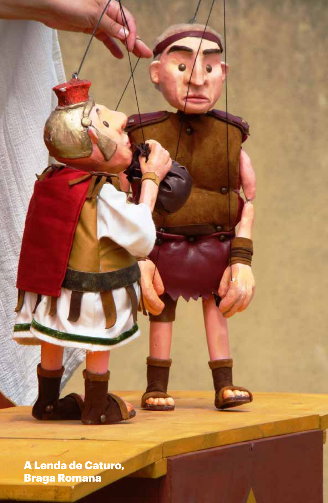
A Lenda de Caturro, Braga Romana