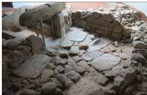
Ed. da Estação de Caminhos-de-Ferro – Largo da Estação