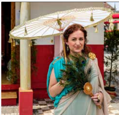
Largo de Santiago

Um Lyceus Romanus recriado na área do “Peristilio” da Domus do Seminário de Santiago, oferece aos visitantes um espaço destinado a várias formas de pedagogia! Poderá aprender, à boa maneira romana, a língua latinae ou língua Graeca na Schola, ou de uma forma mais lúdica, aprender brincando na Crepundia, com jogos, brinquedos e atividades dinamizadas, ou até mesmo aprender história através de tetos de marionetas que contam lendas encenadas para si!