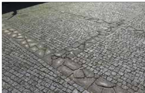
Largo de S. Paulo