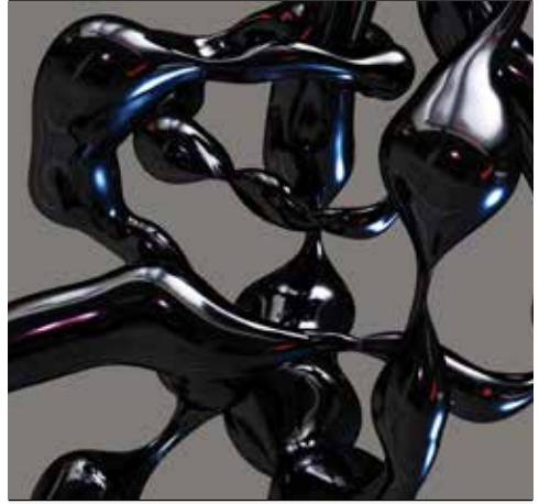
Galeria Duarte Sequeira

ORG: CÂMARA MUNICIPAL DE BRAGA / APOIO: ARQUIVO MUNICIPAL DE LISBOA