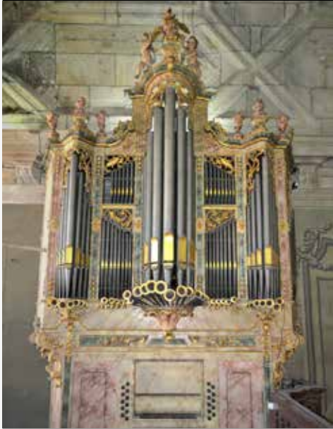
Igreja dos Terceiros