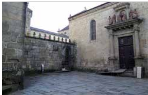
Largo D. João Peculiar

TEL. 253 273 706, 253 615 844 / MDDS@CULTURANORTE.GOV.PT / WWW.MDDS.CULTURANORTE.PT