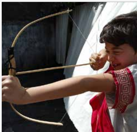
Seminário de Santiago

O quotidiano da cidade de Bracara Augusta