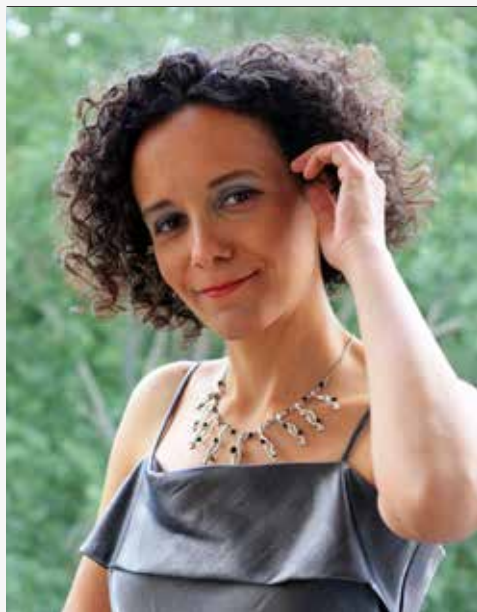
Igreja de São Marcos (do Hospital)