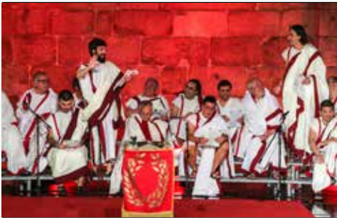
Rossio da Sé – Palco Apolo

Todas as novas cidades fundadas por Roma eram precedidas por um ritual imperioso que sagrava o território e o delimitava, lançando as bases do seu ordenamento. Iniciado por altos sacerdotes, o ritual culmina com o pronunciar do nome da divina urbe de Bracara Augusta, e o protagonismo das “filhas” da deusa Vesta, que acenderão e protegerão o fogo sagrado da cidade para toda a eternidade.