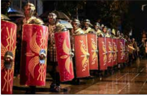
Avenida Central (Início do cortejo)