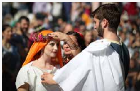
Palco Neptuno – Átrio do Museu D. Diogo de Sousa