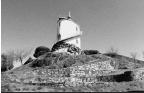
Miradouro do Sagrado Coração de Jesus – Universidade Católica de Braga