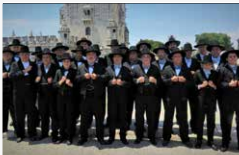
Igreja de Santa Cruz