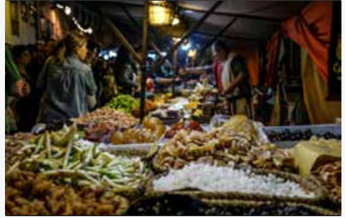
Platea Apicii – Praça do Apício, Largo das Carvalheiras e Platea Gari – Praça do Garum, Largo de S. Paulo

ESPAÇO DINAMIZADO: IEFP – CENTRO DE EMPREGO E FORMAÇÃO PROFISSIONAL DE BRAGA