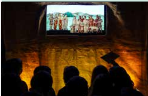
Spatium Ludicum – Sala de Pedra do Museu Pio XII