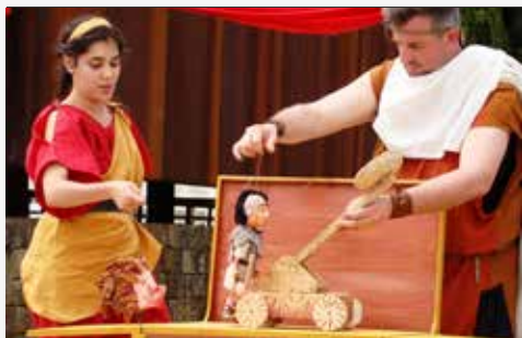
Lyceus Romanus (Área Pedagógica) – Seminário de Santiago

INSCRIÇÕES: INSCRICOES.CULTURA@CM-BRAGA.PT / PÚBLICO-ALVO: 1º, 2º E 3º CICLO