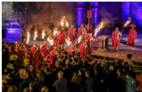
Palco Neptuno – Átrio do Museu D. Diogo de Sousa

Um casamento romano era sinónimo de festa e alegria e, na grande maioria dos casos, de grandes alianças políticas e económicas. O ritual da cerimónia é recheado de momentos simbólicos da mitologia clássica, como também de notáveis partes lúdicas que durante o banquete deliciam os noivos e seus convidados.