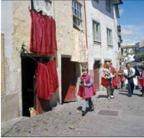
Casa dos Crivos