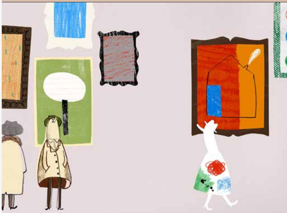
Casa dos Crivos