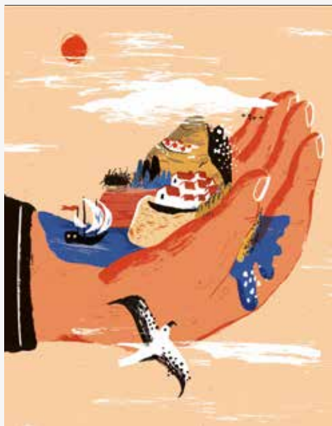
Edifício do Castelo