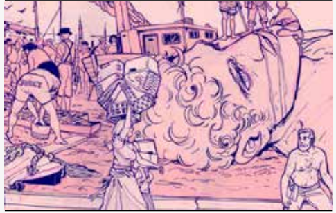
Edifício do Castelo

Codex Gigas é o maior manuscrito medieval do mundo com os seus 22 cm de largura e 92 cm de altura, também conhecido como a Bíblia do Diabo, criado por volta de 1300 d.C. Codex Gigas é também o título de uma exposição de livros em grande formato feitos de dobras sucessivas de papel que procura dobrar a redobrada resistência dos mais jovens à leitura. Uma exposição XXL dos diabos.