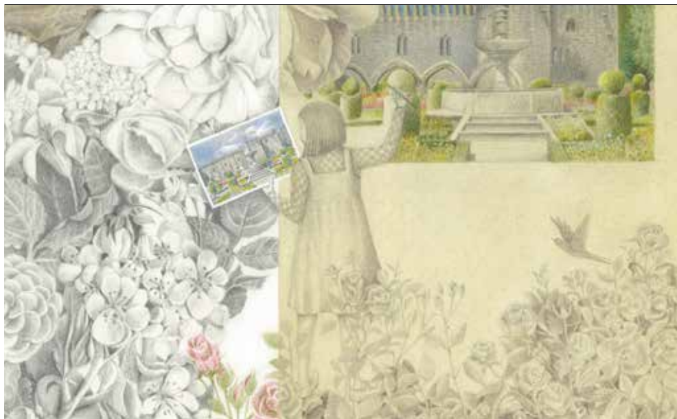
Casa dos Crivos