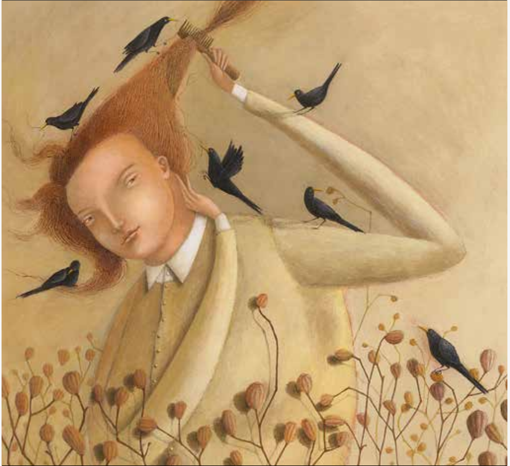
Edifício do Castelo