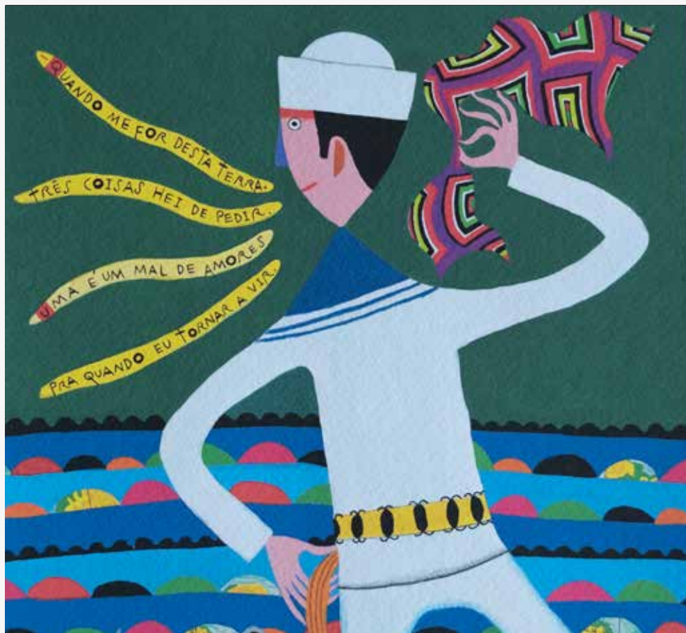
Edifício do Castelo