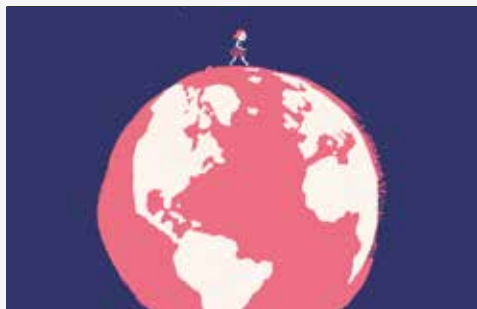
Edifício do Castelo