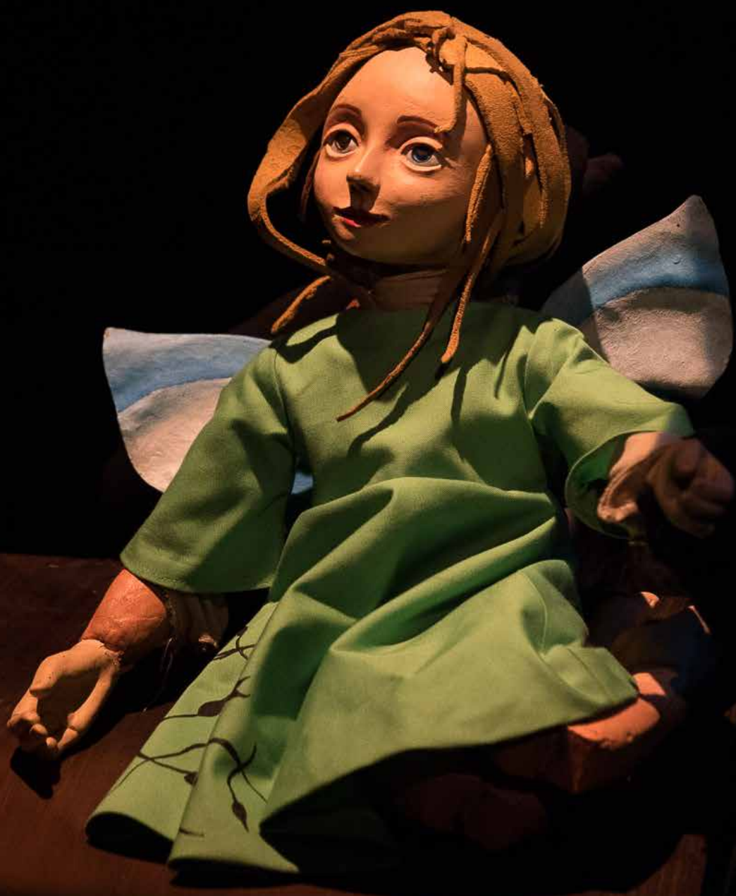
Fada Oriana por Teatro do Bolhão