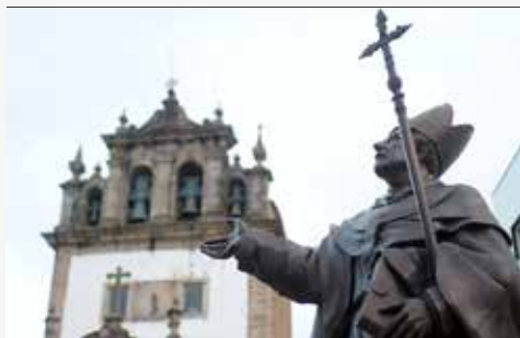
Campo Novo (Estátua de D. Pedro V)