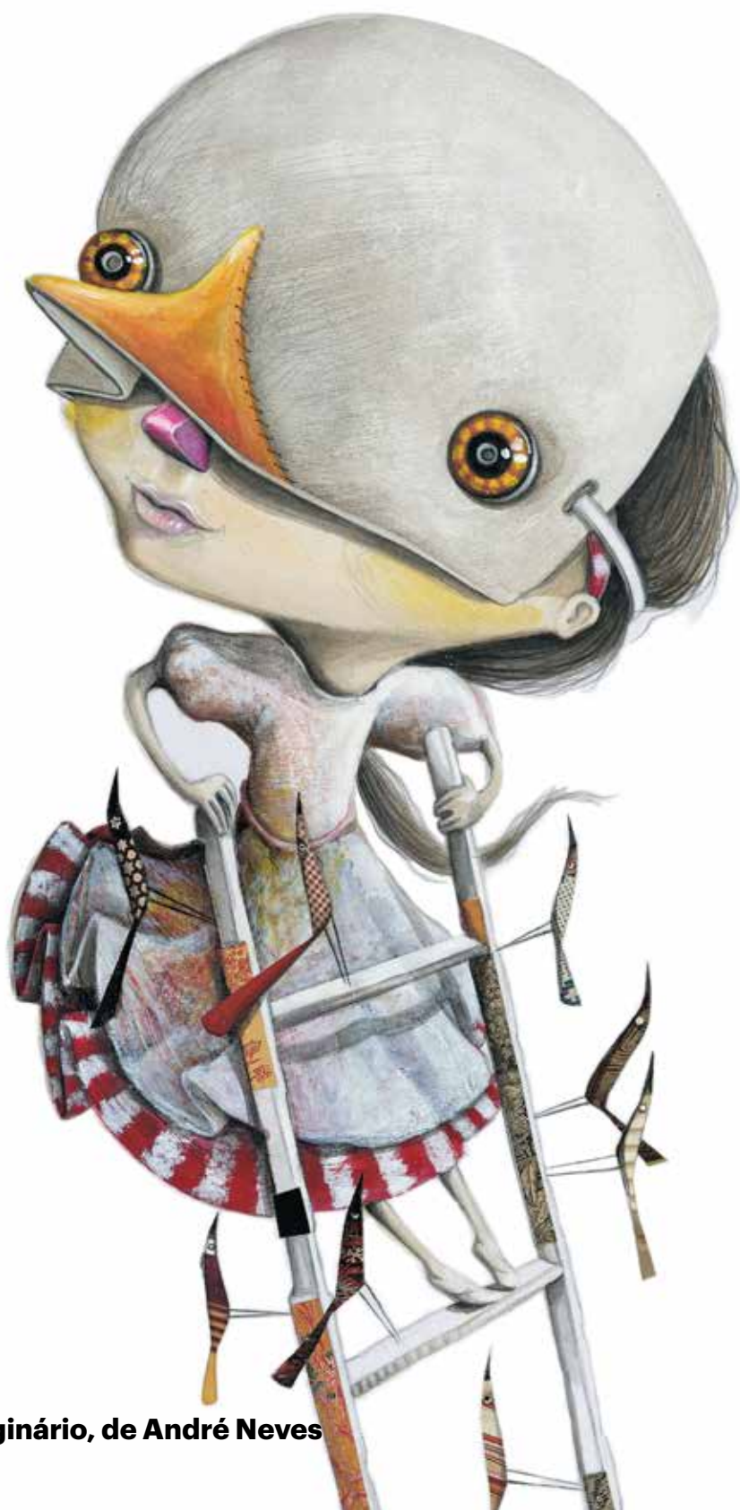
3 X Imaginário, de André Neves