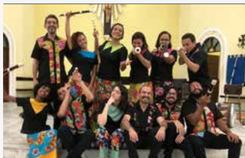
Largo do Paço *