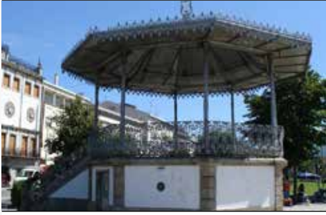
Coreto da Avenida Central