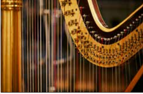
Bombeiros Voluntários de Braga