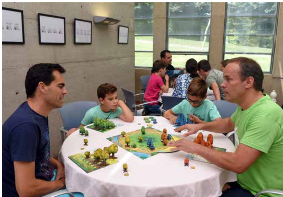
Ludoteca da Estufa – Parque S. João da Ponte