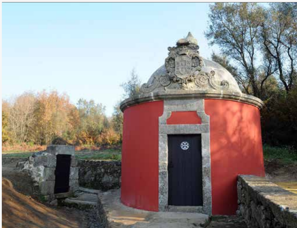
Largo de Monte D'Arcos (Ponto de encontro junto à entrada do cemitério)