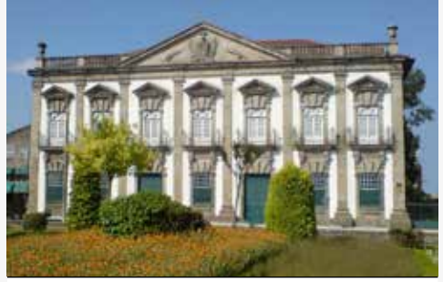
Casa dos Cunha Reis, Campo das Hortas

ENTRADA LIVRE (CONDICIONADA À LOTAÇÃO DO ESPAÇO) / PÚBLICO-ALVO: INFANTOJUVENIL / DURAÇÃO: 50'