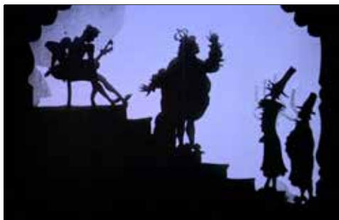
Edifício do Castelo