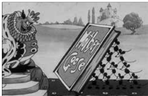
Edifício do Castelo