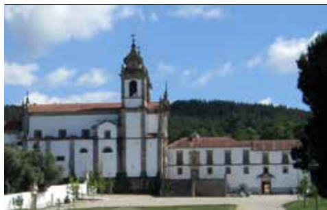
Mosteiro de S. Martinho de Tibães – Sala do Recibo