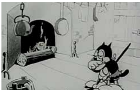
Edifício do Castelo