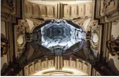
Basílica dos Congregados