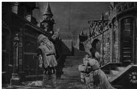
Edifício do Castelo