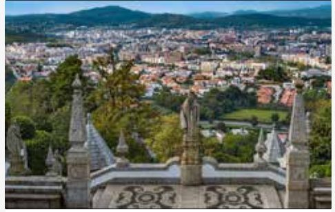
Zona exterior ao Museu D. Diogo de Sousa [viagem de autocarro] – Ponto de Encontro