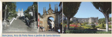
Bom Jesus, Arco da Porta Nova e Jardim de Santa Bárbara

Do Aeroporto do Porto (Sá Carneiro), pode utilizar o "Get Bus"/transporte direto ao centro de Braga, com a duração de 50 minutos. No Posto de Turismo e na Sé Catedral o peregrino pode obter: - A Credencial do Peregrino - O carimbo From Oporto Airport to Braga - Get Bus - shuttle 50 minutes. At the Tourist Office or in the Cathedral, pilgrims can get: - The Pilgrim's Credential - The Stamp