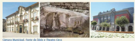
Câmara Municipal, Fonte do Ídolo e Teatro Circo