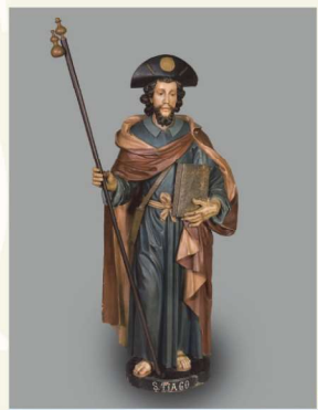
Imagem de S. Tiago Peregrino - Sé Catedral

Almoço / Lunch: 6,50 € Jantar / Dinner: 7,00 €