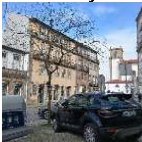
Figura 2 – Imagem da envolvente do exemplar