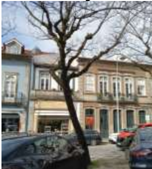
Figura 2 – Imagem da envolvente do exemplar