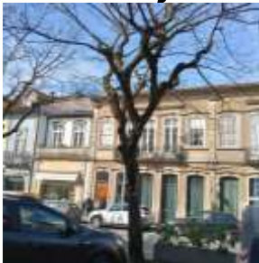
Figura 2 – Imagem da envolvente do exemplar