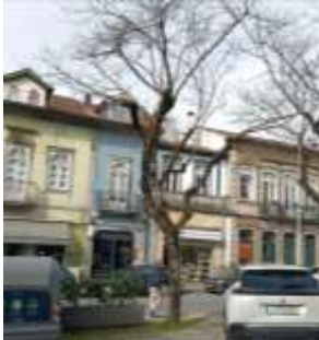
Figura 2 – Imagem da envolvente do exemplar