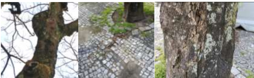
Figura 3 – Imagem do exemplar arbóreo

Observam-se diversos indicadores de comprometimento estrutural e fitossanitário. Numa das pernas é identificada uma ferida ativa, com exposição de lenho enegrecido e presença de exsudado. O escurecimento do lenho sugere necrose do tecido xilemático, frequentemente associada à instalação de agentes patogénicos. A exsudação, por sua vez, constitui uma resposta fisiológica típica a infeções provocadas por agentes bióticos.