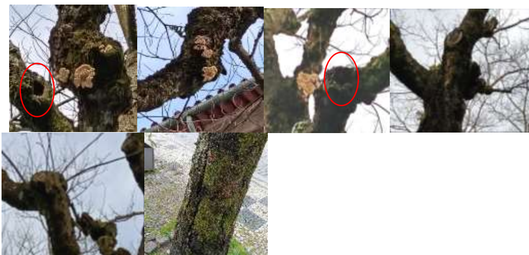
Figura 3 – Imagem do exemplar arbóreo

Observa-se a presença de cavidades em duas pernas, resultantes de processos de degradação interna do lenho. Estas cavidades comprometem a capacidade de suporte das pernas afetadas, aumentando o risco de fratura, especialmente em condições de vento ou sob peso adicional da copa.