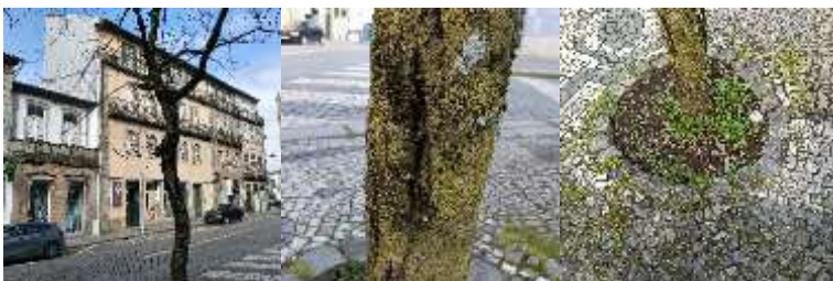
Figura 3 – Imagem do exemplar arbóreo

Exemplar arbóreo com boas condições fitossanitárias, apenas observamos fissuras longitudinais no tronco consideradas normais na espécie em questão.