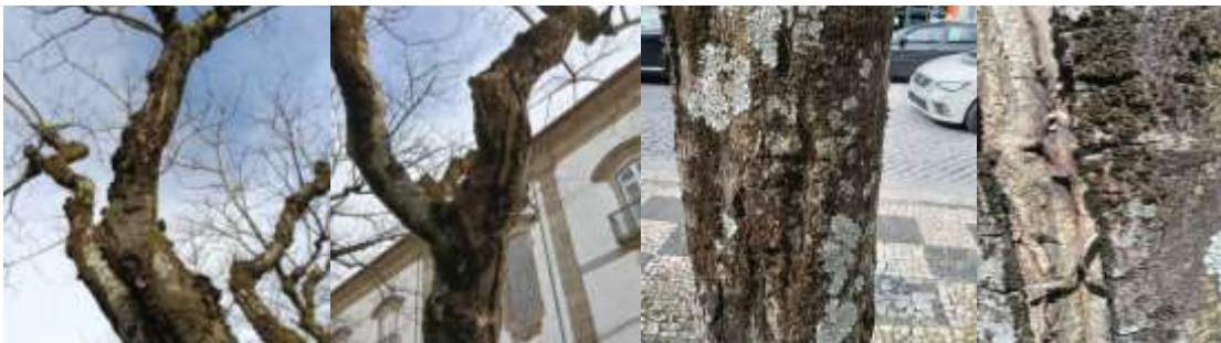
Figura 3 – Imagem do exemplar arbóreo

Observa-se a presença de uma grande quantidade de carpóforos distribuídos por diferentes zonas da árvore. A emergência de carpóforos revela que o processo de decomposição interna do lenho já se encontra numa fase avançada, uma vez que a frutificação ocorre apenas quando o micélio está bem estabelecido no interior dos tecidos. A atividade destes fungos degradadores compromete de forma significativa a diminuindo a resistência mecânica da madeira.