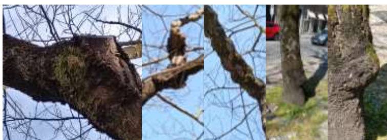
Figura 3 – Imagem do exemplar arbóreo

Verifica-se a presença de uma deformação compatível com cancro no tronco. Este tipo de deformação resulta geralmente da atividade de agentes patogénicos que provocam morte localizada de tecidos, levando à formação de calosidade assimétrica e perda de continuidade estrutural. Cancros ativos constituem um ponto crítico de fragilidade, podendo evoluir para necrose progressiva e comprometer a condução de seiva.