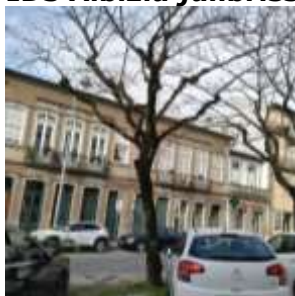
Figura 2 – Imagem da envolvente do exemplar