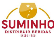
TABELA NOITE BRANCA BRAGA 2023