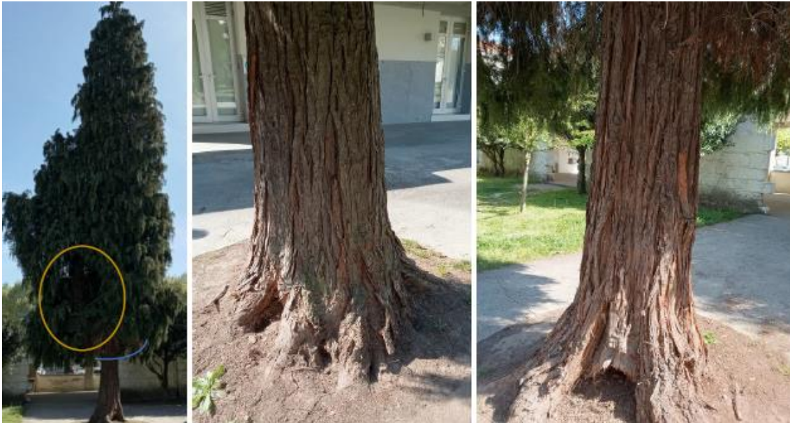
Figura 5 – Fotografias do Falso-cipreste a estudo na Escola Secundária Sá de Miranda.

Por todos estes sinais e/ou sintomas recorreremos ao resistógrafo como ferramenta complementar de diagnóstico de modo a verificar a presença de “defeitos” internos, e se estes colocariam em causa a estabilidade mecânica deste exemplar.