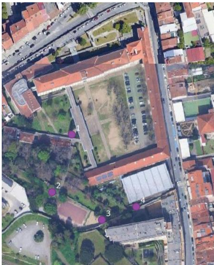
Figura 3 – Localização dos exemplares avaliados na Escola Secundaria Sá de Miranda, Braga.