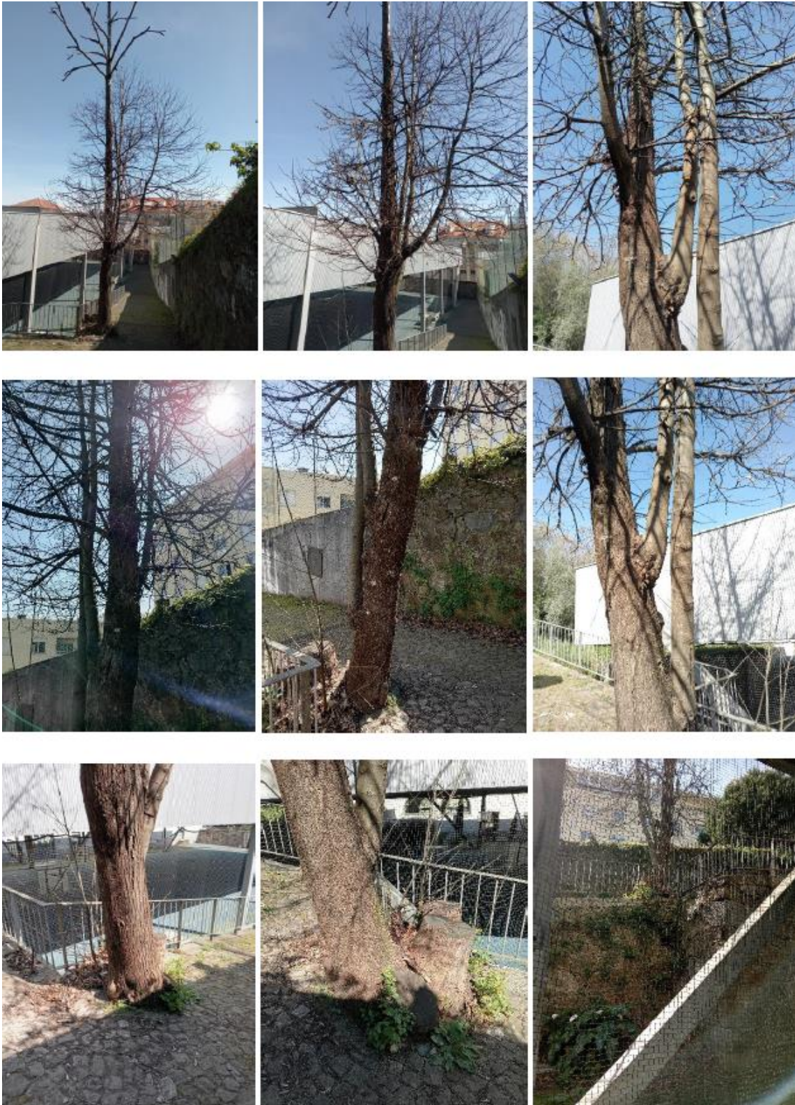
Figura 11 – Fotografias do Castanheiro com ID4, a estudo na Escola Secundária Sá de Miranda.

destes 3 (três) ramos), leva-nos a concluir, que está comprometida a sustentação destes 3 ramos (Figura 11).