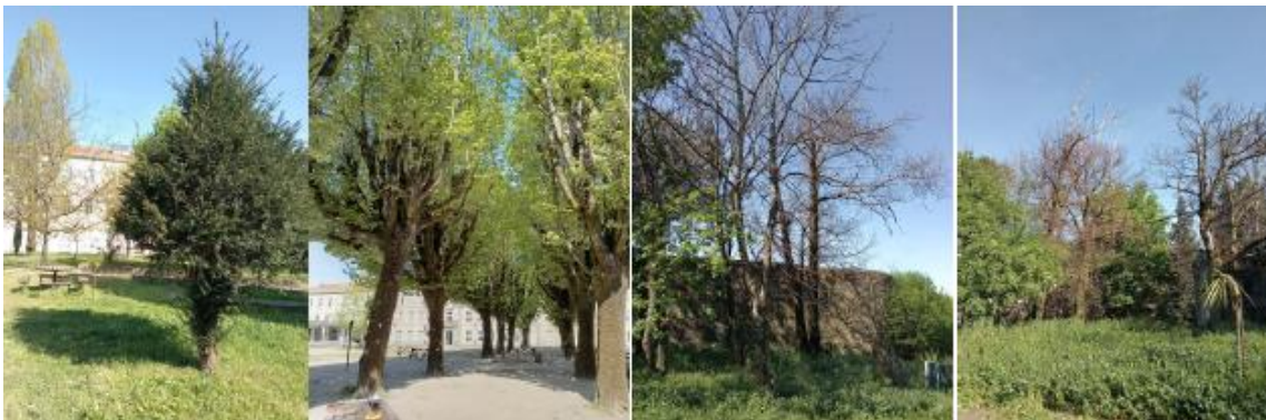
Figura 2 – Fotografias de diversas zonas no espaço escolar (recreio) e quinta, na Escola Secundária Sá de Miranda, Braga.

Na Escola Secundaria Sá de Miranda os exemplares arbóreos estão distribuídos pelas diversas zonas do espaço escolar (recreios) e pela quinta. Aquando da visita aos 2 exemplares referenciados, alargamos o estudo da condição fitossanitária e avaliação do potencial risco de queda e/ou fratura a outros 2 exemplares referenciados pelo Sr. José Lima (funcionário).