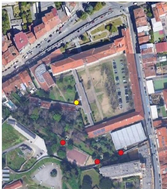
Figura 13 – Plano final de intervenção na Escola Secundária Sá de Miranda.

Relativamente ao exemplar Falso-cipreste ( Chamaecyparis lawsoniana (A. Murray) Parl.), com ID1, recomendamos o corte dos ramos secos no geral, especialmente no andar inferior da copa. Também sugerimos o levantamento deste andar inferior da copa (elevar a base da copa) para facilitar a circulação da comunidade escolar, assim como a diminuição da carga do lado norte (N) da copa, para favorecer o equilíbrio da mesma. Deve-se remover somente o necessário. Esta operação deverá ser efetuada de acordo com as boas praticas e em época própria. Aconselhamos a monitorização anual deste individuo.