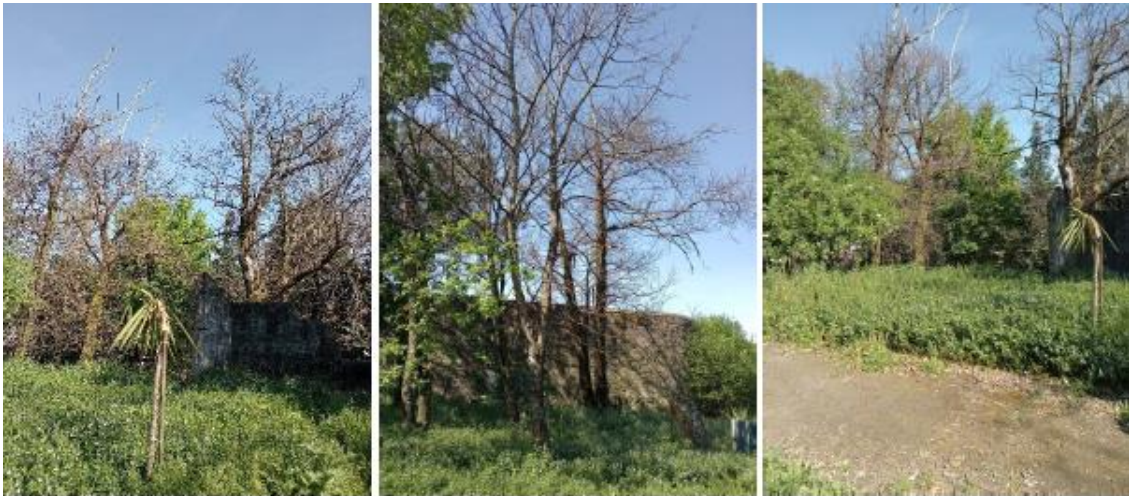
Figura 12 – Fotografias da área da quinta em sistema agroflorestal, na Escola Secundária Sá de Miranda.

Na restante área da quinta está presente um sistema silvoflorestal, com gamos e em que a principal espécie arbórea é o Castanheiro ( Castanea sativa Mill.), que no geral tem uma condição reduzida (Figura 12). É de salientar que o acompanhamento destes exemplares arbóreos relativamente às restantes áreas de recreio da escola é menor, pois também é uma área, menos frequentada pela comunidade escolar (área reservada), por consequência o risco relativamente aos alvos é mais reduzido.