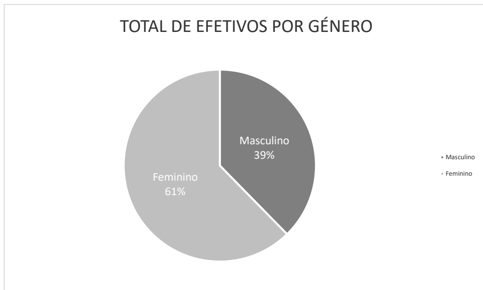
Quadro 1.1. Contagem dos prestadores de serviços segundo a modalidade de prestação de serviços e género